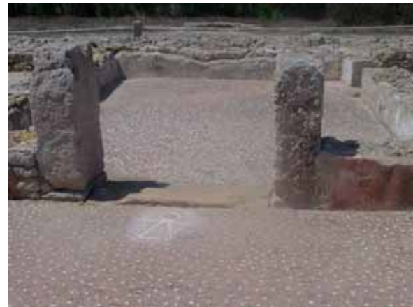
(チュニジア、ケルクワン遺跡、タニト紋様)