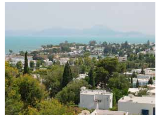
(チュニジア、ビュルサの丘から軍港)