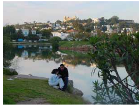
(チュニジア、軍港跡からビュルサの丘)

上記日程上の時間はアリタリア航空を利用した場合の時間です。他の航空会社を利用した場合は時間・経由地等が変更になる場合があります。 航空機の遅延や現地事情により利用交通機関・日程・ホテル等が変更になる場合があります。 訪問地の内、赤字部分の箇所は入場観光、青字部分は下車観光、その他の箇所は車窓など簡単な観光の予定です。 日程中のお食事/観光について：☐=朝食 ☒=昼食 ☒=夕食 ☐=食事なし ✈=機内食 ✨=飛行機 ⇄=バス 朝=06:00~08:00/午前=08:00~12:00/昼=11:00~14:00/午後=12:00~17:00 夕刻=17:00~19:00/夜=19:00~23:00