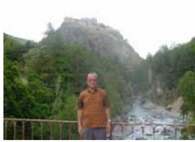
(ケラース渓谷の岩にて)

1929年生まれ。旧制大阪大学理学部卒、理学博士。神戸大学工学部教授、同大学国際交流センター長、同大学院自然科学研究科長などを歴任。定年退官後、1997年まで甲南大学理学部教授。現在神戸大学名誉教授。その間、米国や豪州などの大学でも教鞭をとる。過去10年以上、ハンニバルの足跡を訪ねて地中海地域各地を回る。訳書「ハンニバルアルプス越えの謎を解く」を出版(白水社、2000年10月)。ハンニバルクラブ・ジャパン会員。